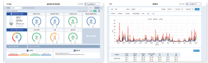
실내 외 공기질 현황